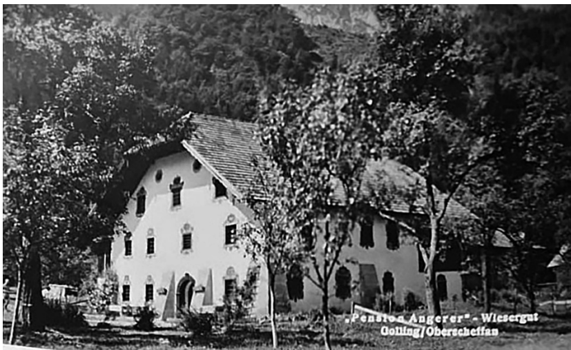
Abbildung 3: Wiesergut – Ansichtskarte aus dem 20. Jahrhundert