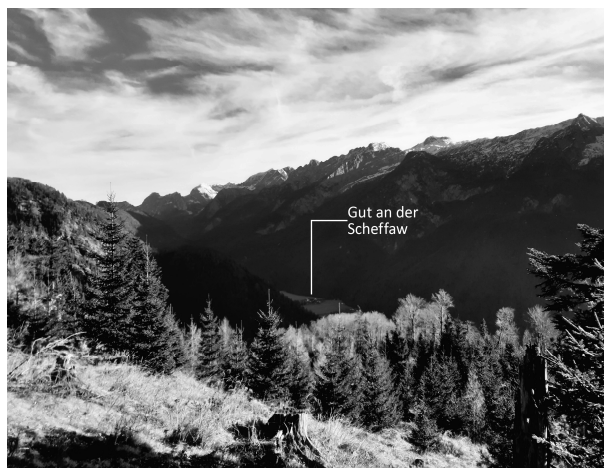
Abbildung 1: Das alte „Gut an der Scheffaw“ – Wiege der Loher

Hier beginnt die Geschichte einer Bauerndynastie, die über die kommenden Jahrhunderte hinweg das Tal prägen und seine Geschicke lenken wird. Es ist ein stolzer Hof, umgeben von ausgedehnten Wäldern und erhabenen Bergen, der die Wurzeln der Loher bildet.