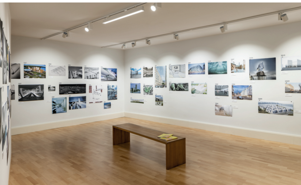
Abb.1, Ausstellung „Architecture Transformed – Das digitale Bild in der Architektur 1980-2020“ im Museum für Kunst und Kulturgeschichte der Philipps-Universität Marburg, Februar 2023