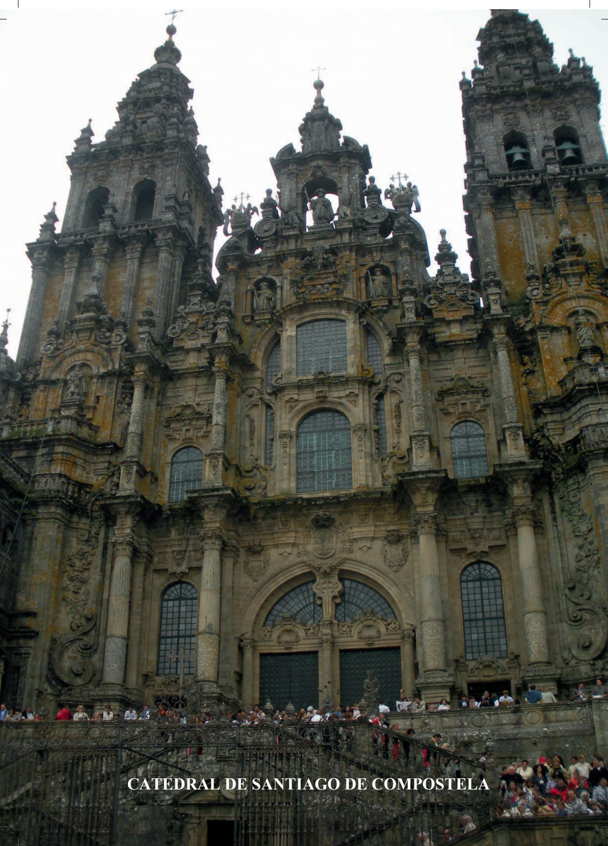
CATEDRAL DE SANTIAGO DE COMPOSTELA