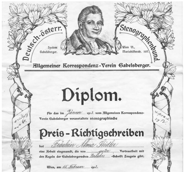
Ausschnitt des Diploms vom „Preis-Richtigschreiben“