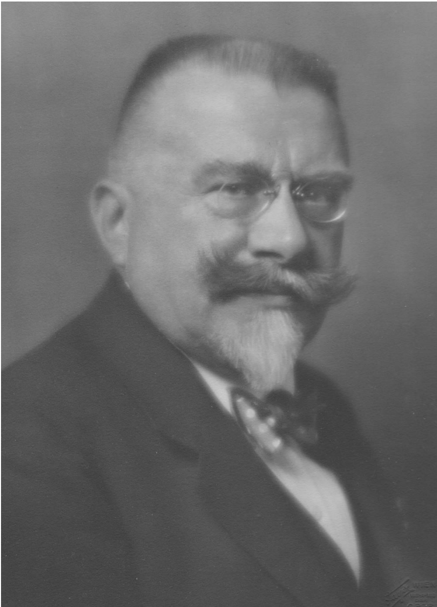
Ministerpräsident Ernst Seidler von Feuchtenegg