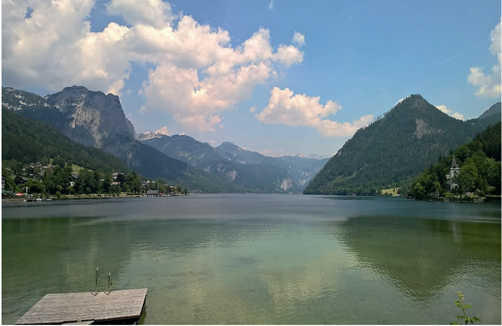
Grundlsee. Badestrand am Westufer