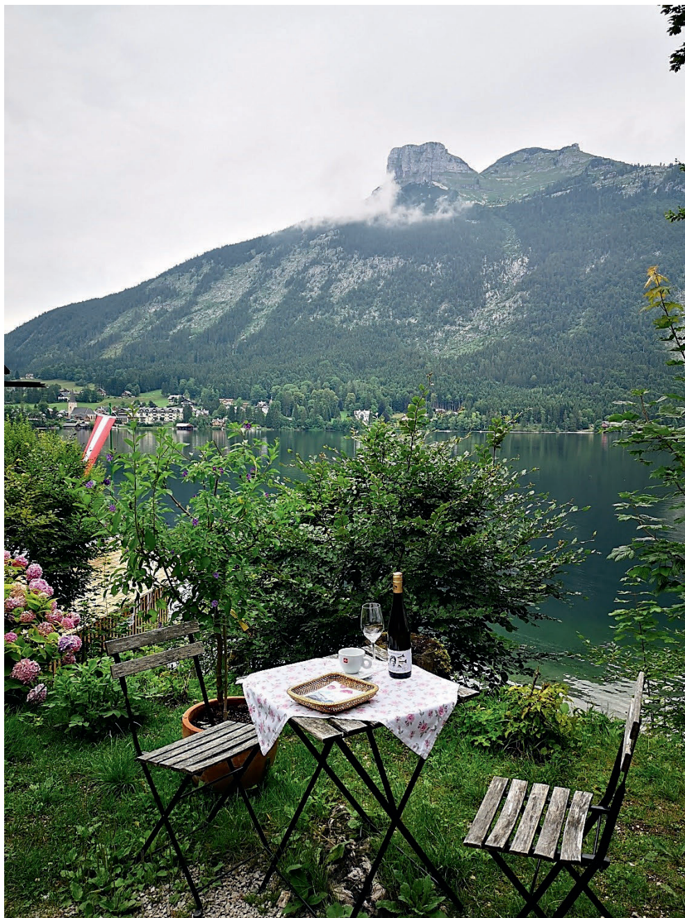
Restaurant Strandcafé Altaussee