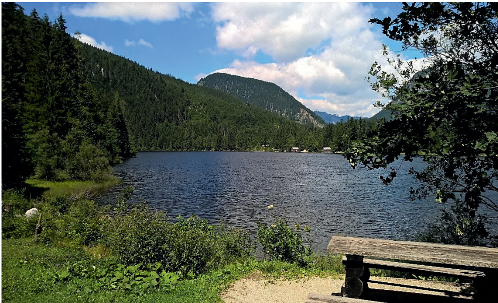
Rastplatz am Ödensee