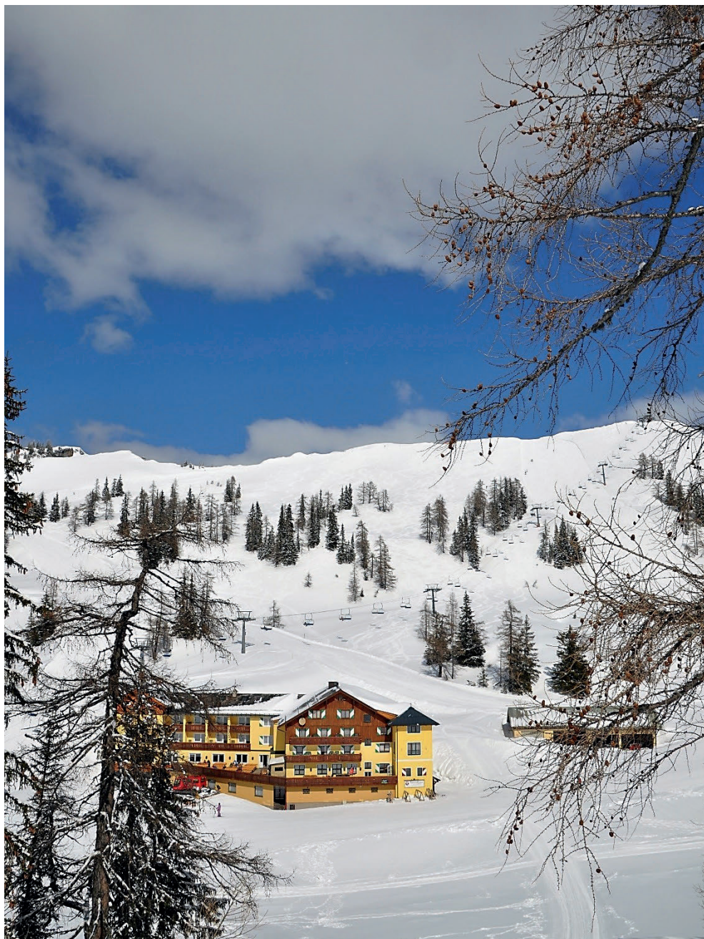
Tauplitzalm. Hotel & Alpengasthof Hierzegger