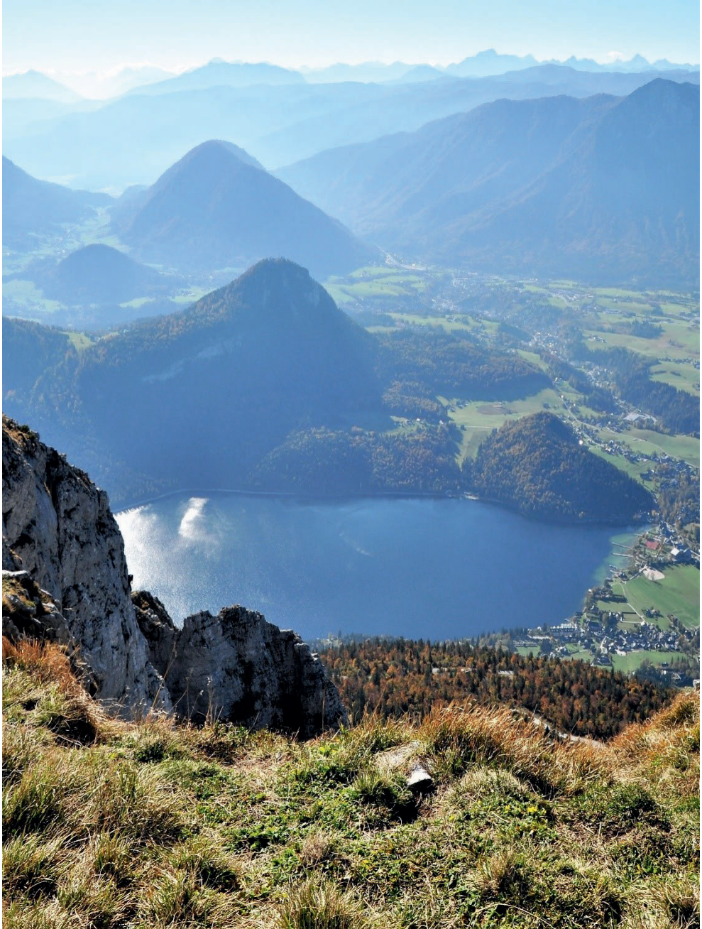
Blick vom Gipfelplateau des Losers auf den Altaussee See