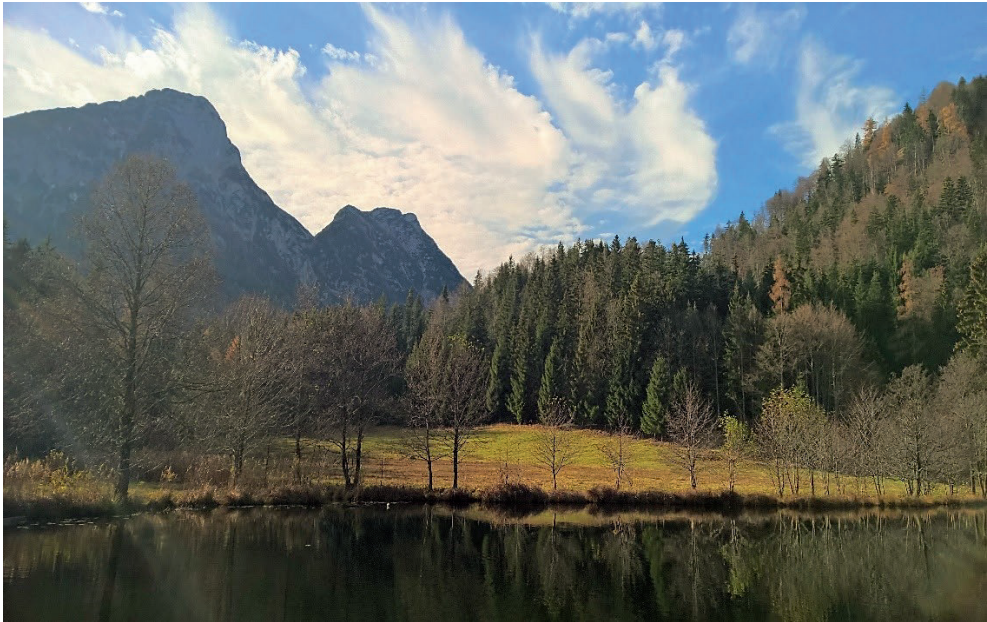
Herbststimmung am Sommersbergsee

Das Grüne Herz Österreichs ist das walddreichste Bundesland. Etwa 60 % seiner Fläche sind mit Wald bedeckt, der für zahlreiche Tier- und Pflanzenarten ein wichtiger Lebensraum und ein von uns vielseitig genutztes Erholungs- und Freizeitparadies ist.