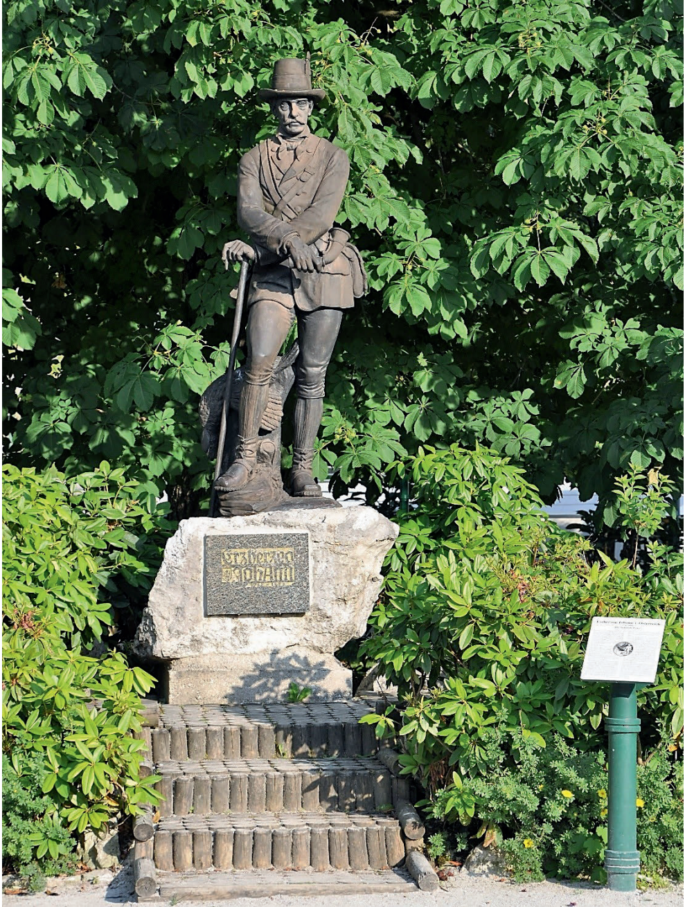
Der Steirische Prinz. Dieses Erzherzog Johann-Denkmal steht im Kurpark von Bad Aussee.