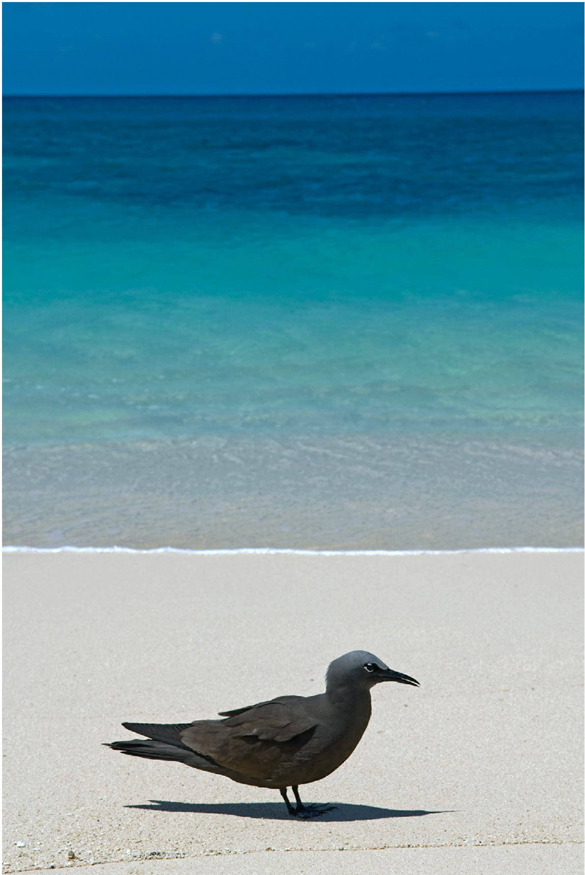
Rußseeschwalbe am Great Barrier Reef - Australien